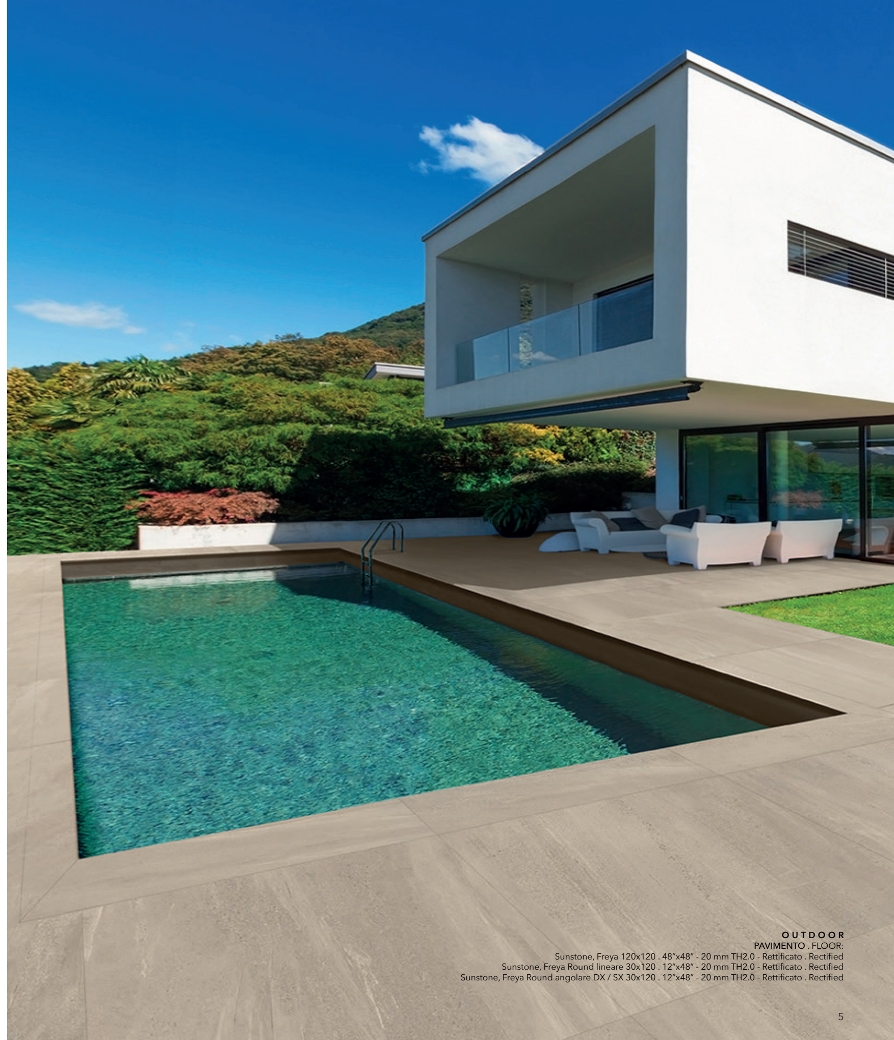
OUTDOOR PAVIMENTO . FLOOR: Sunstone, Freya 120x120 . 48"x48" - 20 mm TH2.0 - Rettificato . Rectified Sunstone, Freya Round lineare 30x120 . 12"x48" - 20 mm TH2.0 - Rettificato . Rectified Sunstone, Freya Round angolare DX / SX 30x120 . 12"x48" - 20 mm TH2.0 - Rettificato . Rectified